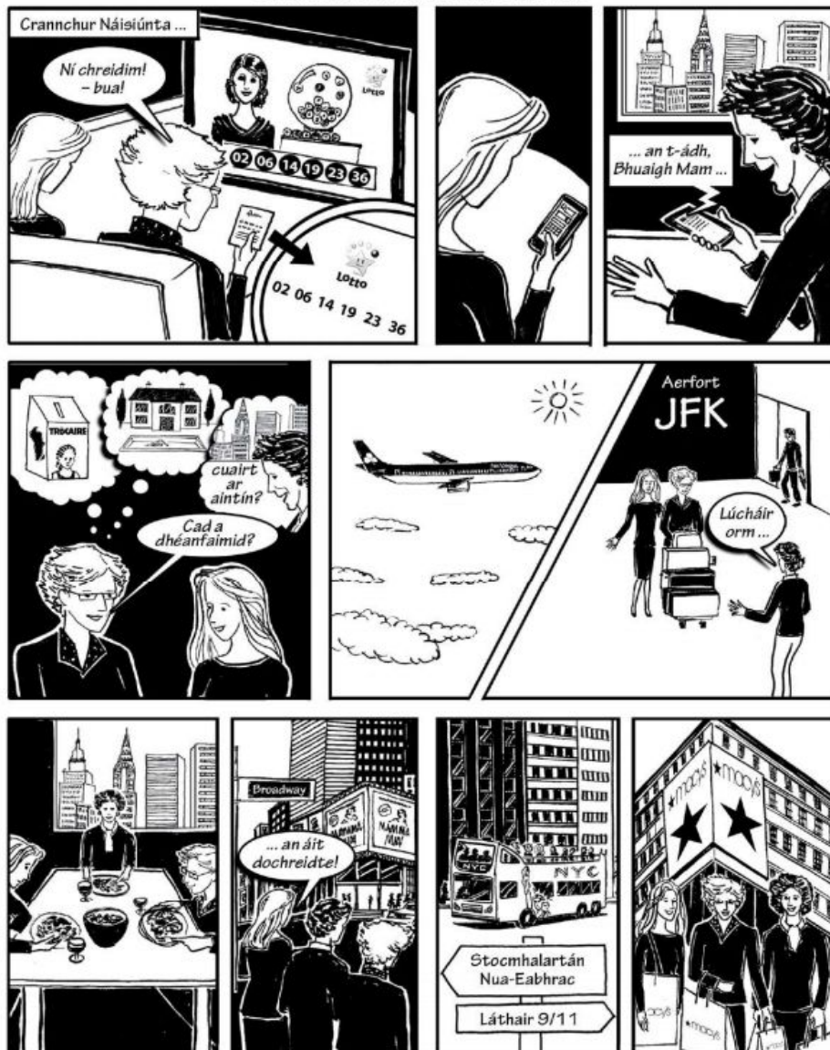
Cuairt ar Aintín i Nua-Eabhrac