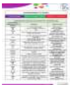
Gníomhbhriathra ón SSM (JCT)