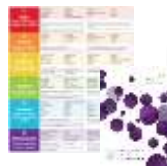
"Fócus ar an bhfoghlaim ón CNCM (NCCA)