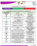
Gníomhbhriathra ón SSM (JCT)