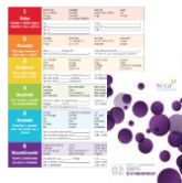
*Fócus ar an bhfoghlaim ón CNCM (NCCA)