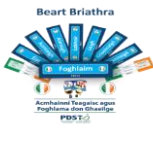
Beart Briathra ón tSFGM (PDST)