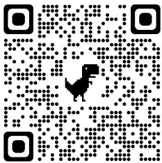
Google Translate app

Is féidir téacs lámhscríofa a aistriú go Béarla ó Úcráinis nó Rúisis ag úsáid aip Google Translate nó Google Translate ar do ríomhaire. Chun treoracha a fháil maidir le cén chaoi an ceamara ar d'fhón a úsáid chun nóta lámhscríofa a scanadh agus a aistriú cliceáil anseo . Chun treoracha a fháil maidir le cén chaoi le méarchlár fíorúil ar do ríomhaire a úsáid chun téacs a aistriú cliceáil anseo .