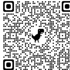
lámhscríofa a scanadh agus a aistriú